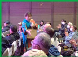
ファンサービスも