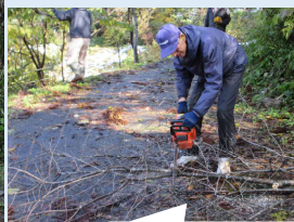
倒木処理も行いました

先月号で令和7年度賛助会員ご加入の企業・団体を紹介しましたが新たにご加入された企業をご案内します。(敬称略・順不同)