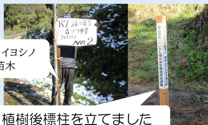
ソメイヨシノの苗木

11月20日(木)に「和山・観音堂」コース内に緑の募金の緑化事業であるソメイヨシノを5本植樹しました。