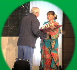
当法人・ファンクラブより花束贈呈