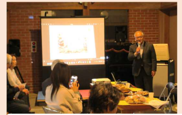
コウノトリについての講演