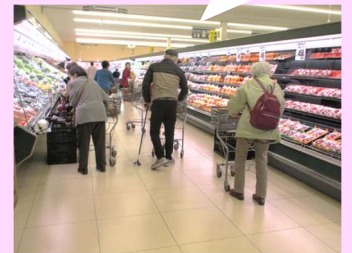
「ラ・ムー」で買物食材や総菜など購入されました